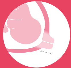
weich & kurz